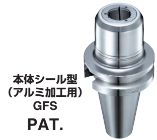
本体シール型 (アルミ加工用) GFS PAT.