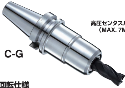
高圧センタスルー対応 (MAX. 7MPa)