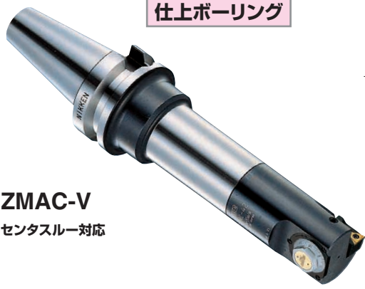
ZMAC-V センタスルー対応