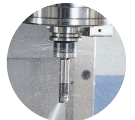
全シリーズ センタスルー対応