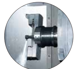
写真はセンタスルー仕様です。