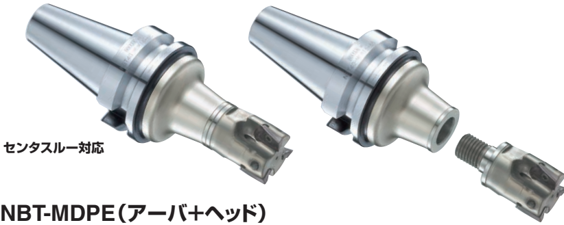
センタスルー対応