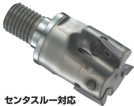
センタスルー対応

★結合部(ねじサイズとインロー径)が同一であれば、全ての超硬メーカーのカッタヘッドが使用出来ます。