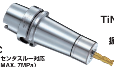
VC 高圧センタスルー対応 (MAX. 7MPa)

TiNベアリングナット標準付属 MAX.40,000r/min 振れ精度 4D先端 3μm以内