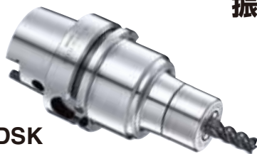
MDSK センタスルー対応