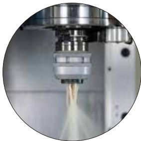
フランジスルー対応 (MAX. 1MPa)